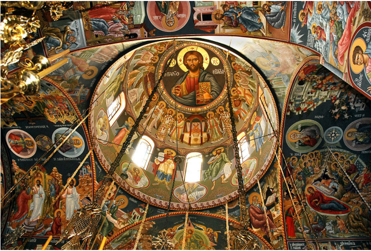
‘Ο Παντοκράτωρ. Τοιχογραφίες Καθολικοῦ

Τό Καθολικό ἀποτελεῖ τό ὁρατό-κτιριακό ἀλλά καί τό πνευματικό κέντρο τῆς Μονῆς. Ἐδῶ τελοῦνται καθημερινά ὅλες οἱ ἀκολουθίες (Μεσονυκτικό, Ὅρθρος, Ὑψος, Θεία Λειτουργία, Ἐσπερινός, Ἀπόδειπνο), ὁ κύκλος τῶν ὁποίων ἀρχίζει τρεῖς ὥρες μετά τά μεσάνυκτα καί κλείνει γύρω στή δύση τοῦ ἡλίου. Στίς Δεσποτικές καί Θεομητορικές ἑορτές, καθῶς καί στίς μνήμες ὀρισμένων ἀγίων, τελοῦνται ἀγρυπνίες κατὰ τό ἀγιορείτικο τυπικό.