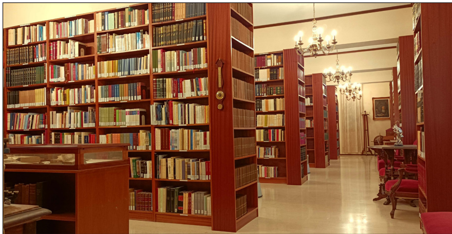
Ἡ Βιβλιοθήκη τής Μονής

Ἡ βιβλιοθήκη ἔχει 30.000 περίπου βιβλία, τόσο ἑλληνικά ὅσο καί ξενόγλωσσα (κυρίως ἀγγλικά, γαλλικά καί ρωσικά).