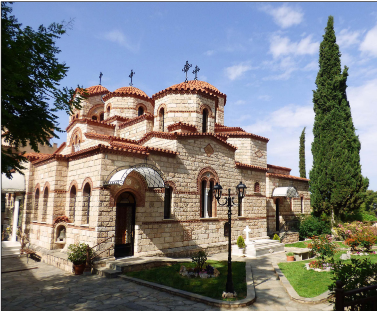
Νοτιοδυτική ἀπόψη τοῦ Καθολικοῦ

Ἡ ἀνοικοδόμηση τῆς Μονῆς ἔγινε σταδιακά μέ προσωπική ἐργασία καί πολλές θυσίες τῶν πατέρων. Τό σπουδαιότερο κτίσμα –κορυφαία εὐλογία τοῦ Παρακλήτου– εἶναι ὁ κεντρικός ναός (Καθολικό), πού θεμελιώθηκε τήν Κυριακή τῆς Ὁρθοδοξίας