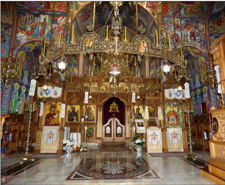
Τό ἔσωτερικό τοῦ Καθολικοῦ

τοῦ 1987, ἀποπερατώθηκε τό 1990 καί ἐγκαινιάσθηκε στίς 12-11-2000 ἀπό τόν ἀείμνηστο μητροπολίτη Ἀττικῆς κυρό Παντελεήμονα (†2014). Ὁ ναός εἶναι κλασικοῦ μοναστηριακοῦ ρυθμοῦ, ἀρχιτεκτονημένος ἀπό τόν ἀδελφό τῆς Μονῆς μακαριστό ἱερομόναχο Ρωμανό (Αλεξόπουλο) πάνω στά πρότυπα τῶν Καθολικῶν τοῦ Ἁγίου Ὁρους καί τῶν Μετεώρων. Περιλαμβάνει καί ἕνα παρεκκλήσιο πρός τιμήν τῶν Ἁγίων Ἀσωμάτων, στή μεσημβρινή πλευρά τῆς Λιτῆς. Οἱ φορητές εἰκόνες εἶναι φιλοτεχνημένες στό εἰκονογραφικό ἐργαστήριο τῆς Μονῆς. Τό 2002 ἄρχισε καί ἡ τοιχογράφηση τοῦ ναοῦ, ἐπίσης ἀπό ἀδελφούς τῆς Μονῆς, ἡ ὁποία καί συνεχίζεται.