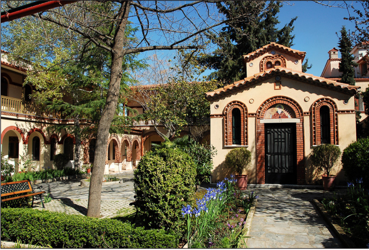
Τό Παρεκκλήσιο τοῦ Ὁσίου Ἰωάννου τῆς Κλίμακος

τοῦ Ὁσίου Ἀθανασίου τοῦ Ἀθωνίτου (πού χρησιμοποίησε ἡ ἀδελφότητα ὡς προσωρινό Καθολικό μέχρι τό 1990), παρεκκλήσιο τοῦ Ἁγίου πρωτομάρτυρος Στεφάνου, ἀρχονταρίκι καί κελλιά μοναχῶν, β) τό παρεκκλήσιο τοῦ Ὁσίου Ἰωάννου τῆς Κλίμακος (1973), γ) τήν ἀνατολική πτέρυγα (1975), μέ κελλιά, δ) τή δυτική πτέρυγα (1981), μέ παρεκκλήσιο τοῦ Ἁγίου Γεωργίου τοῦ Τροπαιοφόρου, βιβλιοθήκη, ξενώνα καί κελλιά, ε) τή βόρεια πτέρυγα (1988), μέ παρεκκλήσιο τοῦ Τιμίου Προδρόμου, συνοδικό, γραμματεία, εἰκονογραφικό ἐργαστήριο, ἐκδοτικό τμήμα, τράπεζα, μαγειρεῖο καί δοχεῖο, στ) τήν πτέρυγα τῶν ἐργαστηρίων (1999), ζ) τή νότια πτέρυγα (2004), μέ παρεκκλήσιο τοῦ Ἁγίου Ἰωσήφ τοῦ Μνήστορος, ἡγουμενεῖο, ἰατρεῖο, ὀδοντιατρεῖο καί γηροκομεῖο, καί η) τόν πυλώνα μέ παρεκκλήσιο τῆς Παναγίας τῆς Πορταΐτισης. Βορειοανατολικά τοῦ