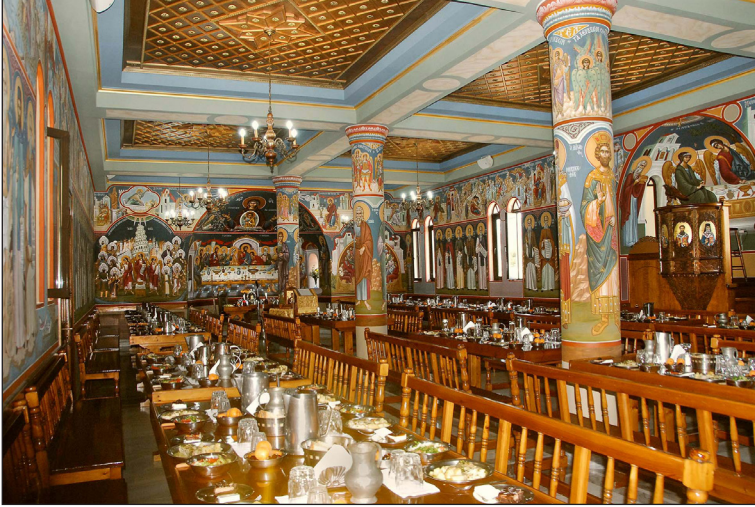
Ἡ Τράπεζα τῆς Μονῆς

Οἱ κύριες ἀσχολίες τῶν ἀδελφῶν, ἐκτός ἀπό τὰ παραδοσιακά κοινοβιακά διακονήματα (ἐκκλησιαστικοῦ, τυπικάρη, ἀρχοντάρη, δοχειάρη, μαγειρίου, μάγκιπα, κηπουροῦ, δενδροκόμου, ἀμπελικοῦ κ.ἄ.), εἶναι ἡ βυζαντινὴ εἰκονογραφία καὶ οἱ ἐκδόσεις βιβλίων ὀρθοδόξου-πατερικοῦ περιεχομένου. Μέχρι σήμερα, μέ τῆ βοήθεια τοῦ Θεοῦ, ἔχουν πραγματοποιηθεῖ ἑκατό περίπου ἐκδόσεις.