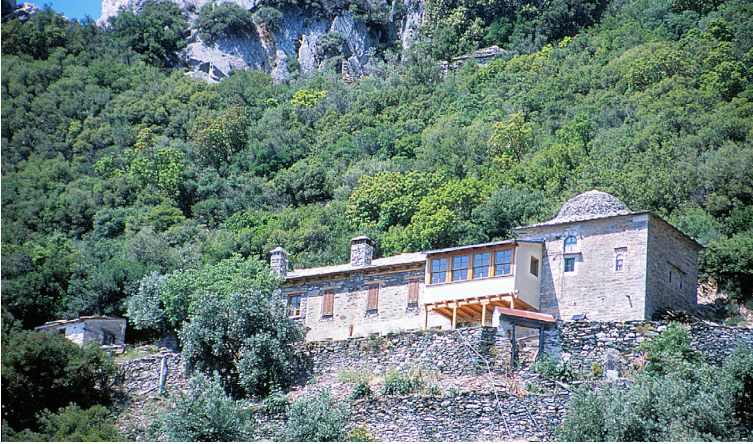
Άγιαννανίτικη Καλύβη του Γενεσίου τής Θεοτόκου