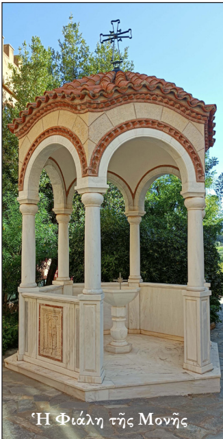
Ἡ Φιάλη τῆς Μονῆς

Ἐκτός ἀπό τό Καθολικό, τό μοναστηριακό συγκρότημα περιλαμβάνει ἀκόμη α) τήν παλαιά κεντρική πτέρυγα –τό πρῶτο κτίσμα (1963)– μέ παρεκκλήσιο