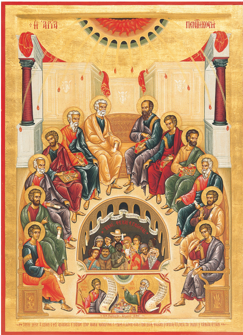
Ἡ Ἁγία Πεντηκοστή

Σύντομα ἡ νέα Ἀδελφότητα αὐξήθηκε ἀριθμητικά μέ ἱκανά στελέχη καί τό ἔργο τῆς ἀπέφερε πολλούς πνευματικούς καρπούς, κάτω ἀπό τὴν ἐμπνευσμένη καθοδήγηση τοῦ γέροντα καί τὴν εὐλογία τῆς τοπικῆς Ἐκκλησίας.